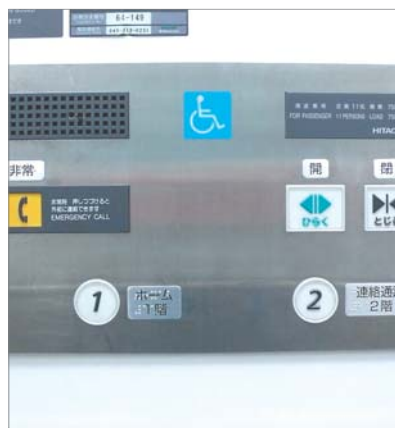
エレベーター点字標示板