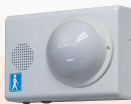
露出型（センサ露出・屋内）