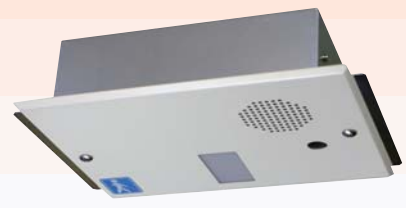
埋込型（センサ内臓）