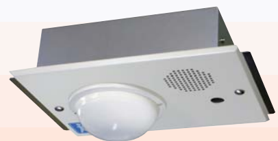
埋込型（センサ露出）