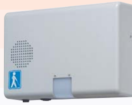
露出型（センサ内臓・屋内）