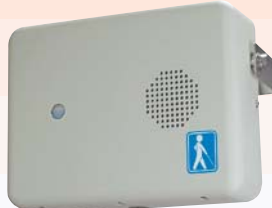
露出型（センサ内臓・屋外）