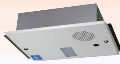
埋込型（センサ内蔵）