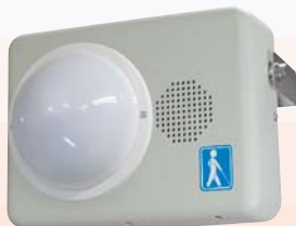
露出型（センサ露出・屋外）