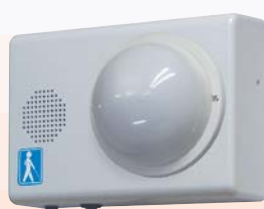
露出型（センサ露出・屋内）