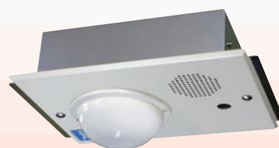
埋込型（センサ露出）