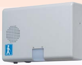
露出型（センサ内蔵・屋内）