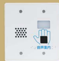
ユニットBで 『インフォメーション』

— [ユニットA]・[ユニットB] 2つのユニットから音声でサポートいたします。 —