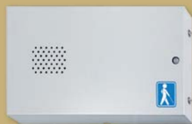
ユニットAで 『ナビゲーション』