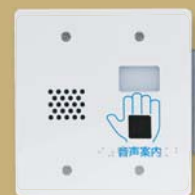
ユニットBで 『インフォメーション』

— [ユニットA]・[ユニットB] 2つのユニットから音声でサポートいたします。 —