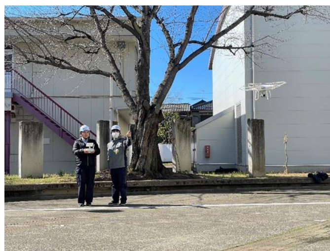
岩槻研修所（教習状況）