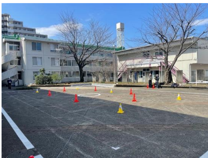
岩槻研修所（検定状況）

ドローン利用の場が拡大されること、ならびに操縦者養成の必要性に鑑み、これまで同社は、各所で講習を実施してまいりましたが、このたび操縦ライセンスの認定に必要な講習施設拠点として、当社の岩槻研修所（旧 ITEA 東日本研修センター）敷地内に新たな教習所を設け、運用を開始いたしました。