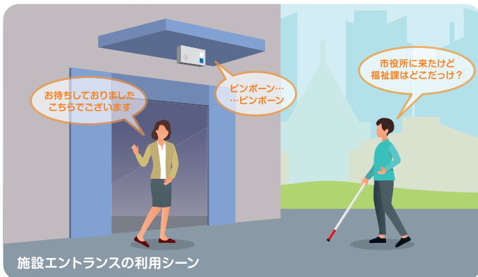
施設エントランスの利用シーン

おんゆうから出入口の位置情報を伝えることで、利用者の誘導を支援します。なお外部オプションにより、施設内のスタッフ(コンシェルジュ)にお知らせすることもできます(シグナルエイド利用時)。