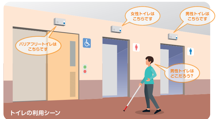
トイレの利用シーン

おんゆうから出入口の位置情報を伝えることで、利用者の誘導を支援します。なお外部オプションにより、施設内のスタッフ(コンシェルジュ)にお知らせすることもできます(シグナルエイド利用時)。